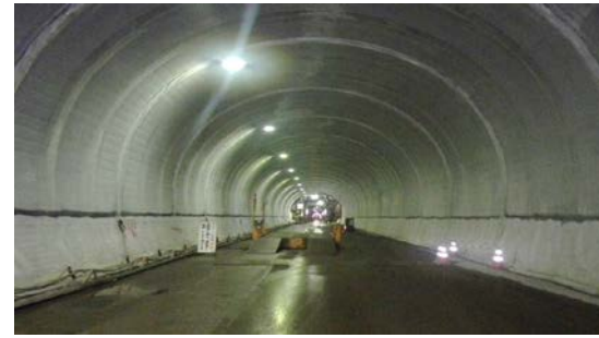
昆布トンネル(桂台)他 FILM施工状況