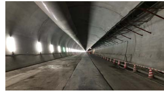
ニツ森トンネル(鹿子)他 防水工施工完了状況