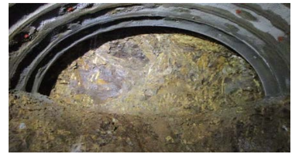
後志トンネル(塩谷) 切羽状況