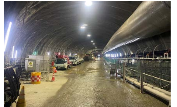
28.ニツ森トンネル(鹿子)他 覆工完了状況