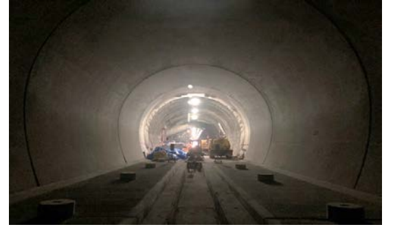
19.国縫トンネル他 出口側坑口部状況