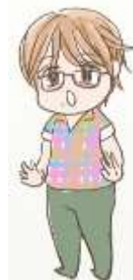
※上土幌町 E さん作画。

平成11～14年度の保健師職始まりの4年間を過ごした赤井川村へ20年ぶりに戻ってきました。育児支援ひよこの会が今も残っていてびっくり！母子保健活動の中で、己の力のなさを感じ、助産師の学校に行く！と決断した私を快く送り出してくれた赤井川村で、残りの職業人生を過ごす予定。一人じゃ何にもできないから、一緒に活動してくれる保健師さん、お待ちしております～♪ 楽しく働きましょう！