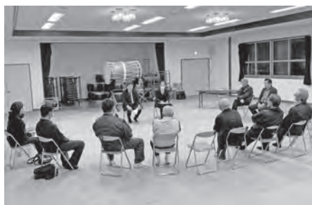
区会懇談会の様子

○住民に対する情報伝達ツ ールとして、防災無線以 外に村の公式Xの活用、 公式LINEなどを検討 できないか。仕事で村を 離れてしまうと情報入手 手段がない。