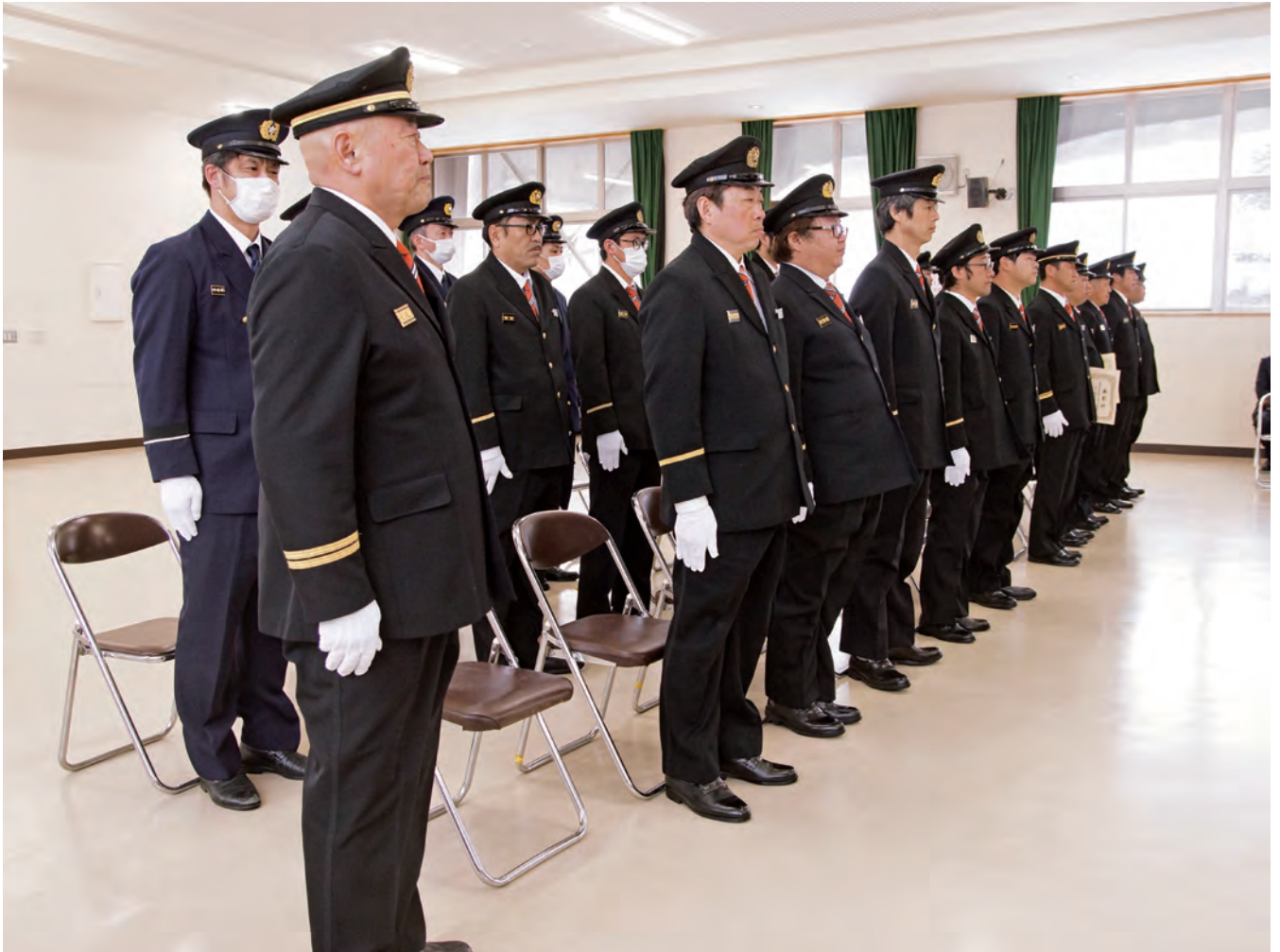
赤井川消防団出初式