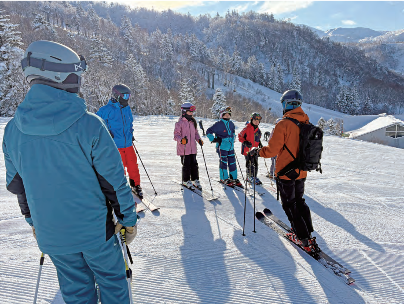
チャレンジスキー教室 I