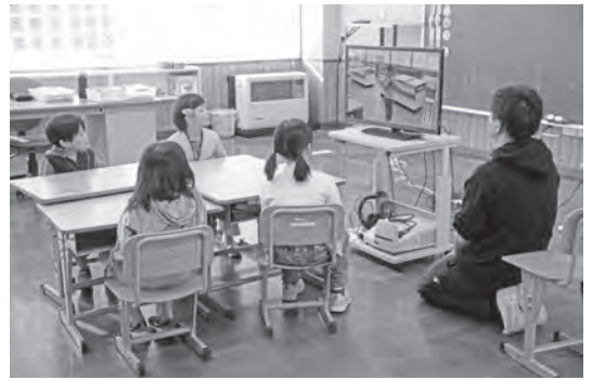
↑赤井川小学校での1日体験入学の様子