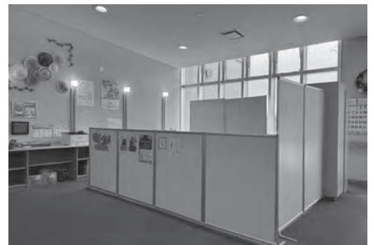
↑健康支援センター内にある事務所の様子

今後も引き続き、令和8年度開設「子ども第三の居場所」にむけて、放課後子ども教室や保育所で子どもたちと触れ合いながらつながりを深めていきたいと思っています。これからはむらのみなさんと交流できるイベントも開催していけたらと思っているのでよろしくお願いいたします！