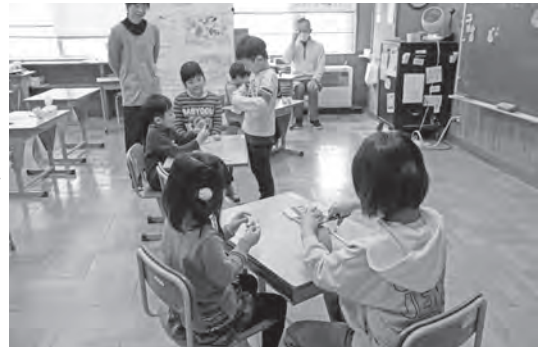
↑都小学校での1日体験入学の様子