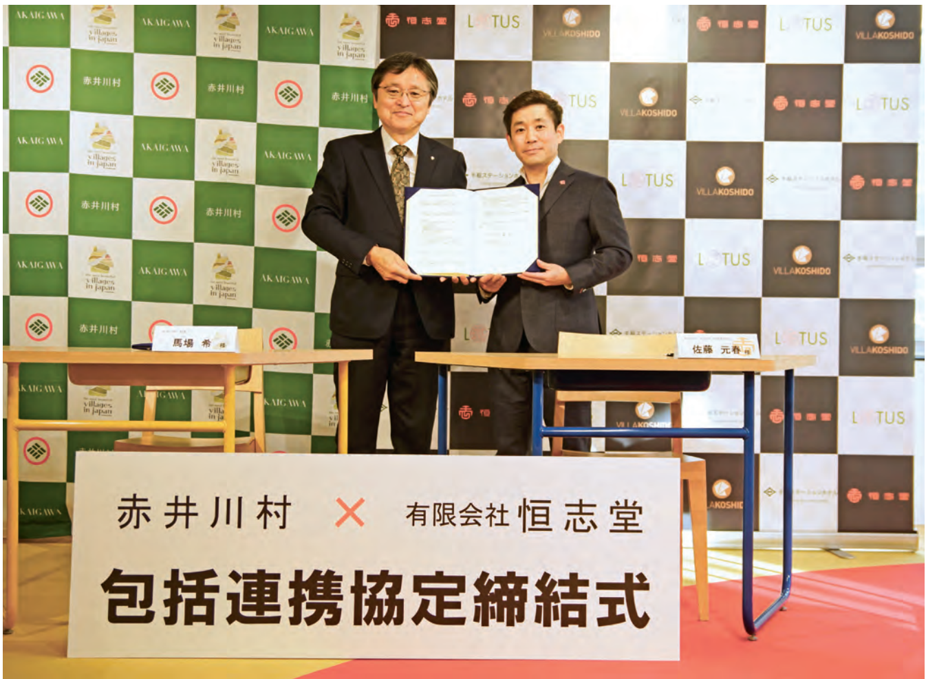
赤井川村と有限会社恒志堂との包括連携協定締結式／2025年1月31日